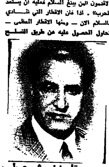
بقلم : نير شوحب

عندما أعلن عبقري القرن العشرين البرت اينشتاين عن نظريته النسبية ، قال بعض العلماء بان الإنسانية لا تفهم هذه النظرية الا بعد ثمانين عاما . فإذ كان هذا الوعي العبقري في عالم الفيزياء والرياضيات فاننا في عالم التفكير المعنوي نتساءل : ترى كم من السنين والإحساب يجب أن نمر حتى نصل إلى الإنسانية مرتبة وعي المثل البسيط الذي امتلته النبي ايشياء في اصحابه الأحادي عشر (فيسكن الذئب مع الخروف ... الخ ؟)